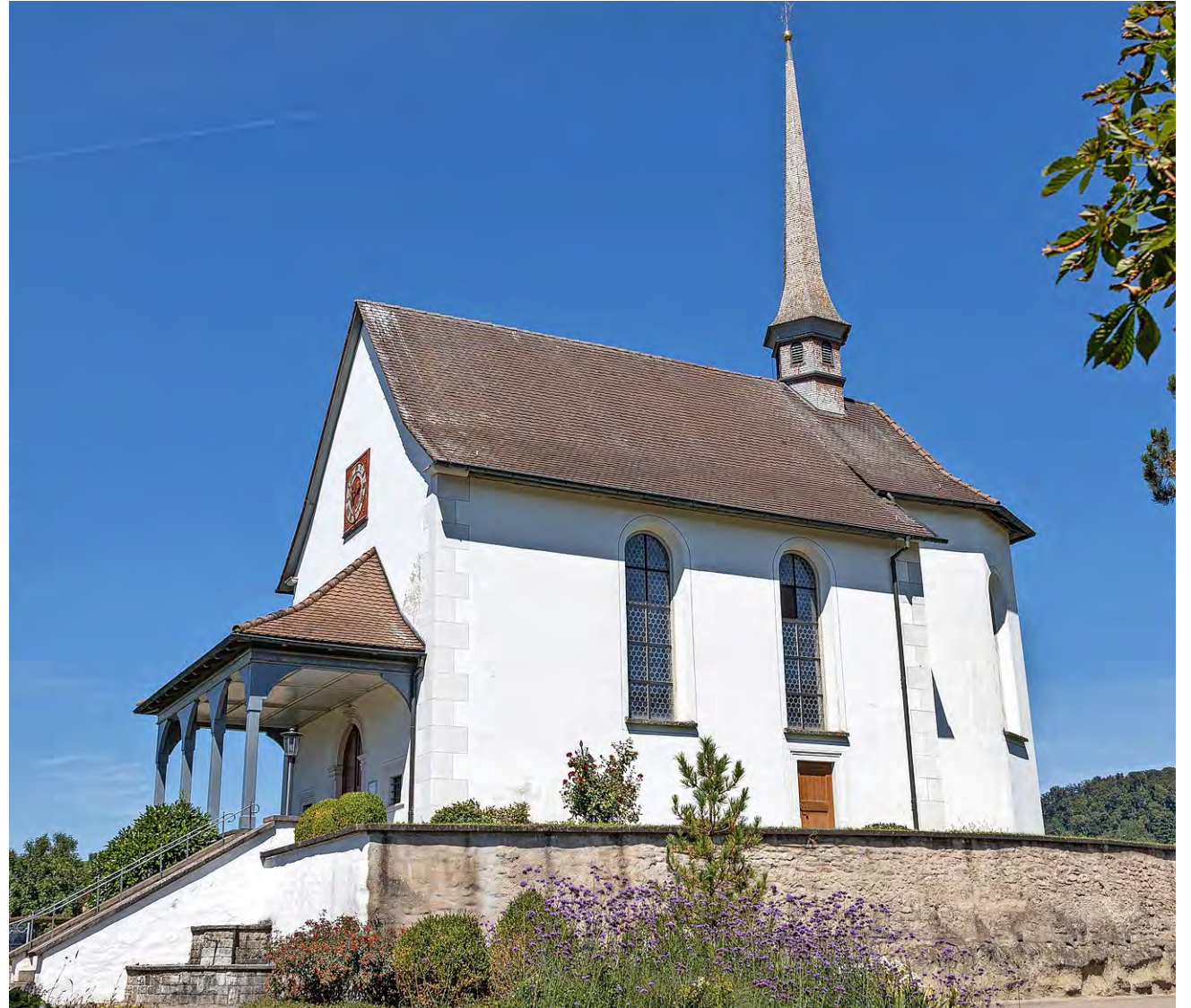
Das Wahrzeichen der Gemeinde: die St.-Antonius-Kapelle.