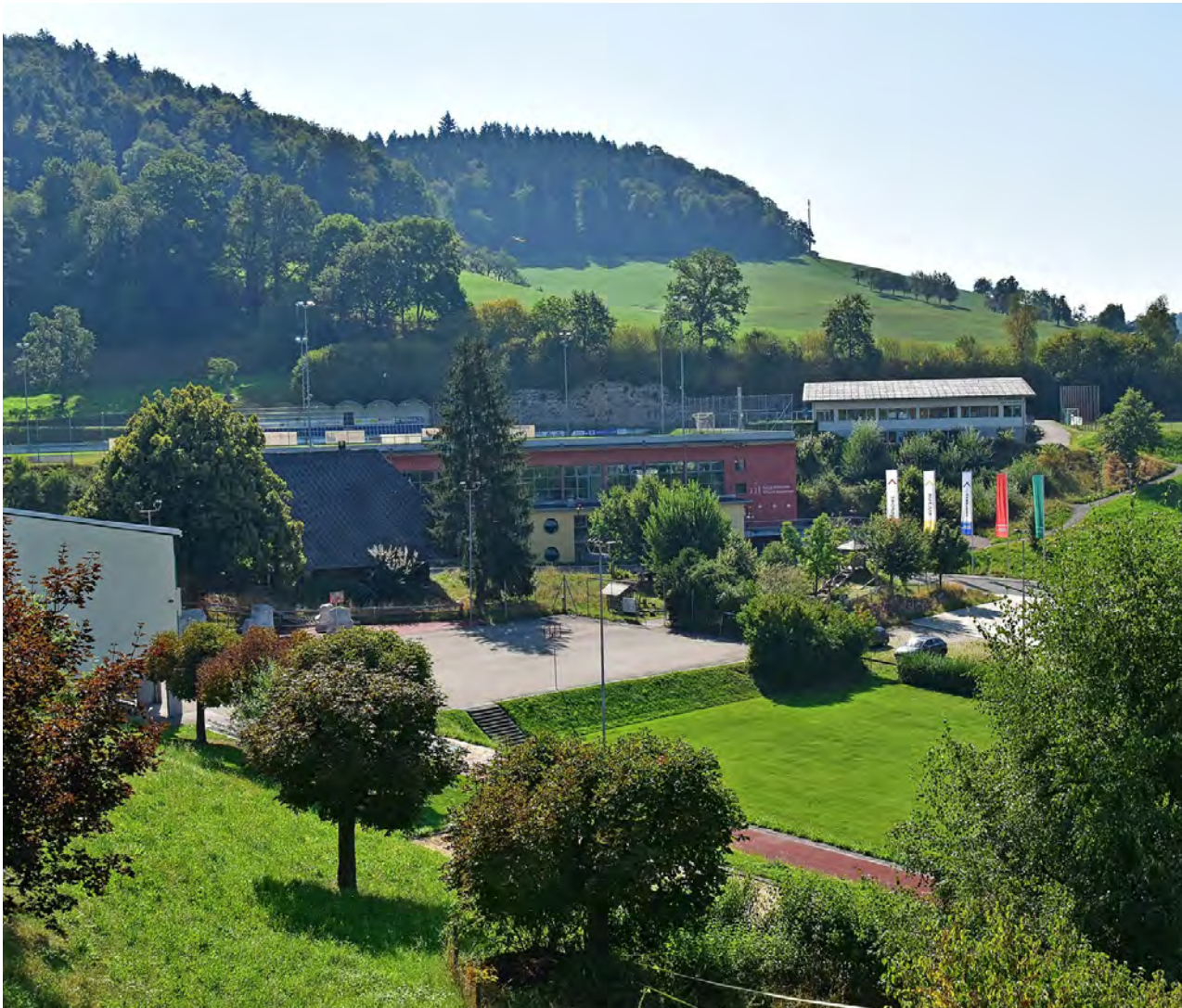
Die Schule mit der Sport-, Kultur- und Freizeitanlage Hiltbrunnen.