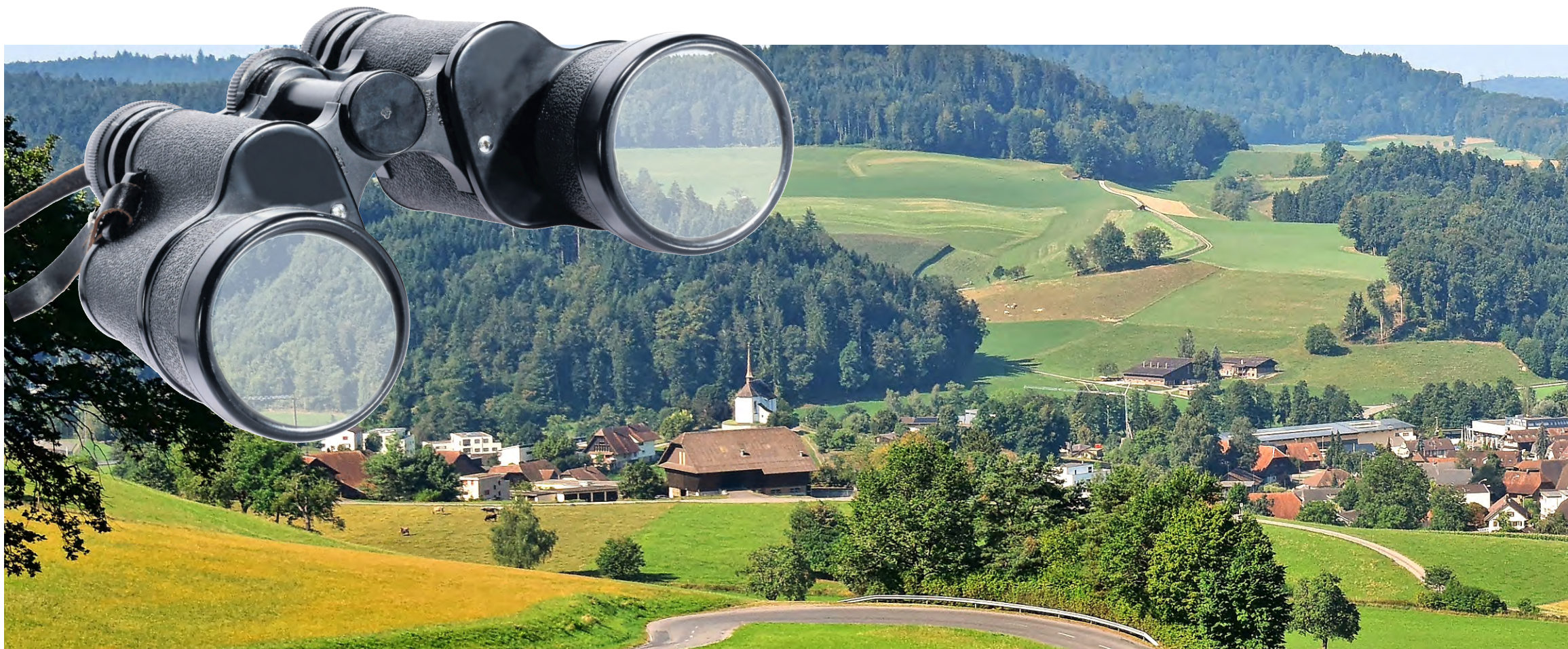
Altbüren an einem heissen August-Tag. Blick von der Staltenstrasse Richtung Dorf.