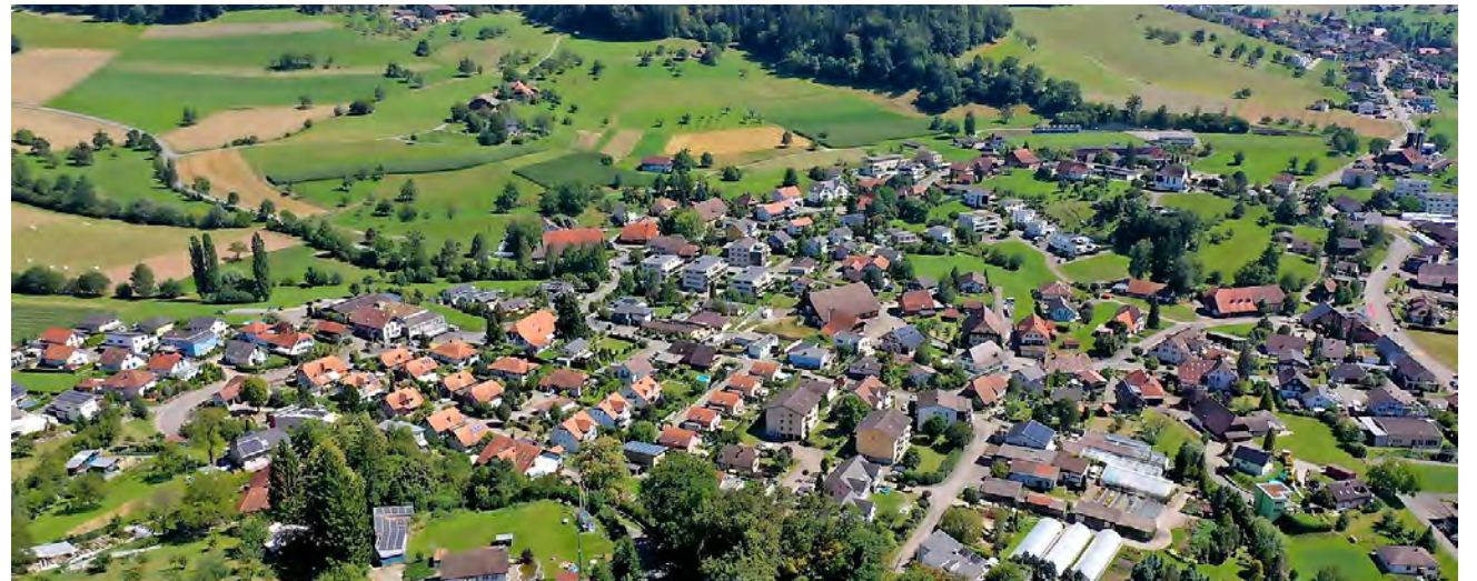
Altbüren aus der Vogelperspektive.